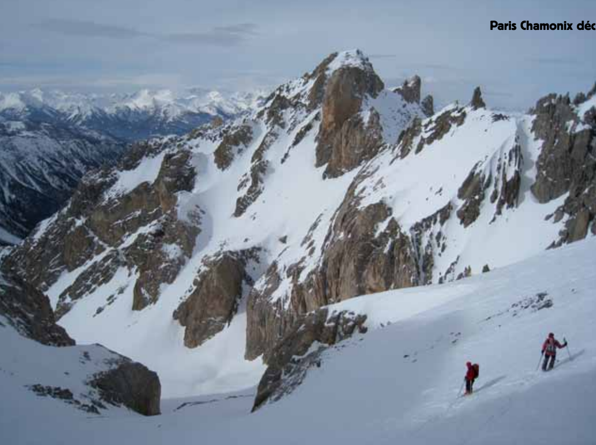
Descente du col nord-ouest des Heuvières, Pic des Veyres.