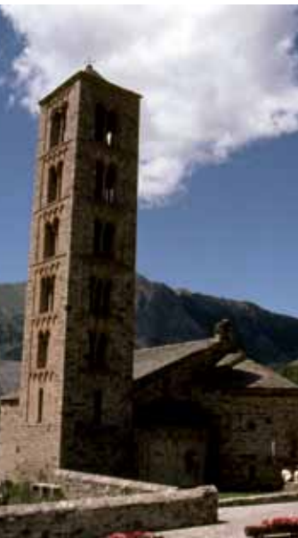
Saint-Clément de Taüll.

D ans ce paysage de granit et d'ardoise où gambadent les isards, des aiguilles frôlant souvent les 3000 mètres se mirent dans plus de cent lacs, les estanys, parfois bordés de pins. Les Encantats et les Besiberri sont les cimes les plus célèbres mais il en est bien d'autres majestueuses. Celles d'Amitges (2840 m), de Montardo (2836 m), de Punta Alta (3014 m), de Suibenix (2949 m), de Peguera (2982 m) sont accessibles aux randonneurs à partir des refuges ou sur une étape un peu courte.