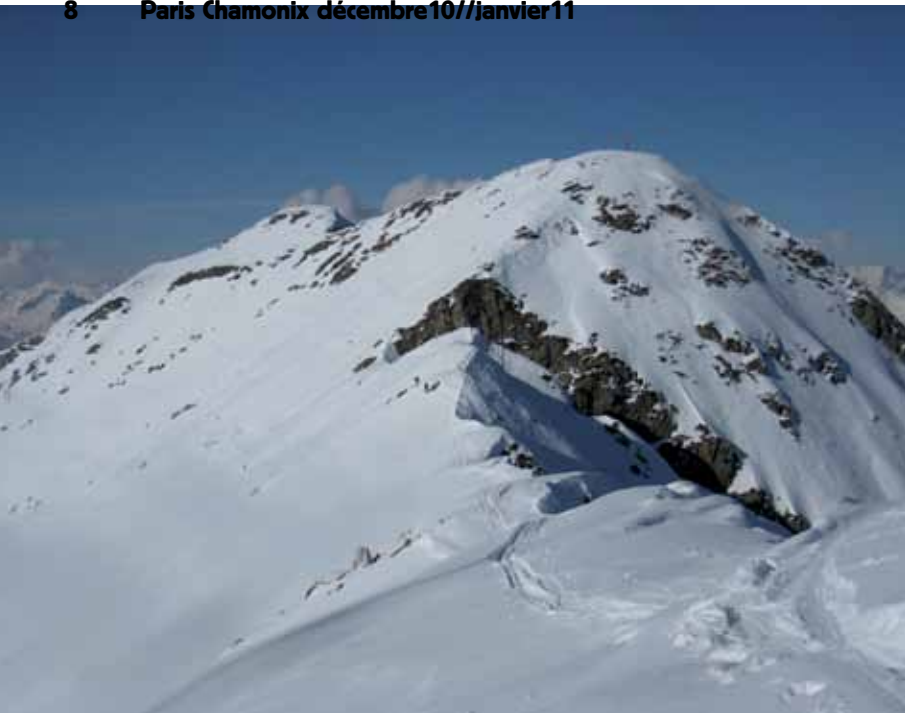
Arête sud-est du Gridone.

Nous errons dans Intragna à la recherche d'un taxi, obtenons un numéro de téléphone, puis patientons une petite heure dans ce fond de vallée glacial, avant de monter enfin dans un taxi, qui nous dépose à Spruga au moment où le soleil commence à éclairer le village. La montée dans des alpages et des forêts clairsemées est très agréable et nous parvenons rapidement au sommet du Pilone (ou Cima Pian del Bozzo), à nouveau sans rencontrer âme qui vive.