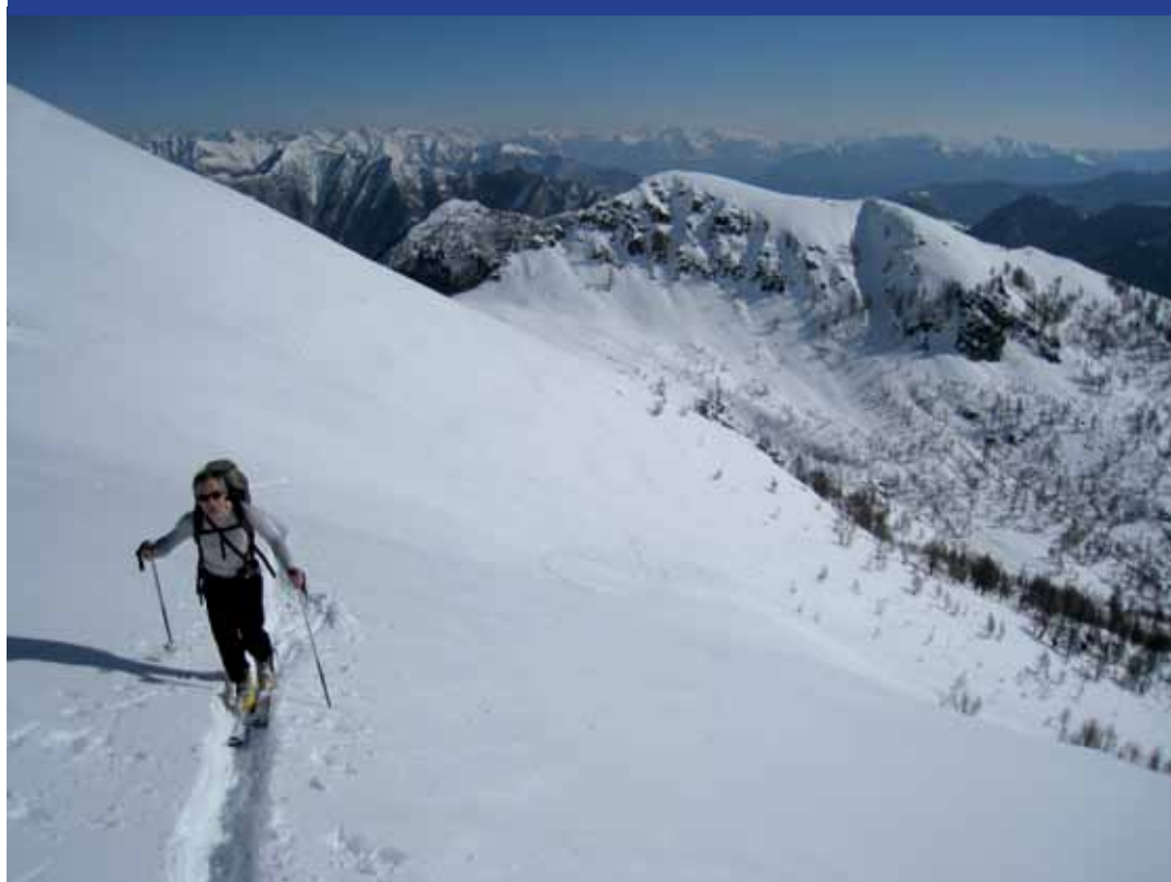
Montée au Pilonet, dans le Tessin.

page 4 // L'écho des sentiers et de l'environnement