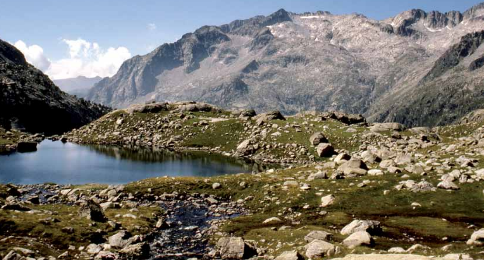
Lac de Travessani et les Besiberri.

Jour 4 : Ref Estany Llong/Ref. La Restanca, 8 h 30. M = 1510 m, D = 1280 m.