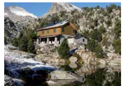
Refuge Joseph M. Blanc.

Enfin, on peut aussi entamer tout circuit à Estany Llong (navette depuis Boï), à Colomina (accès par téléphérique au fond du Val Fosca), à Ernest Mallafré (accès routier par Espot). ▲