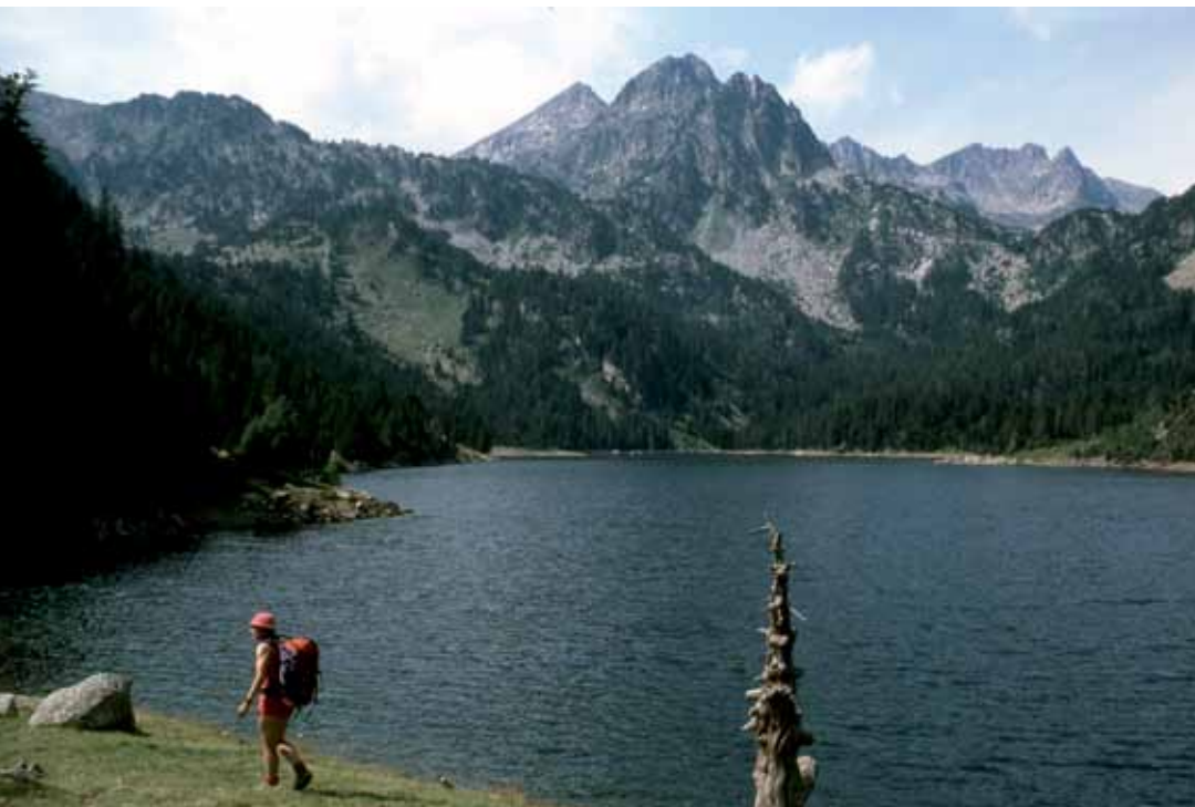
Lac de Sant-Maurici.

Au sud-ouest du lac de la Restanca, rejoindre celui de Mar. Le longer par l'est puis monter vers le col de l'Estan del Mar (2468 m). Descendre sur le lac Tort. Par sa rive est, on rejoint le lac Rius et le GR11.