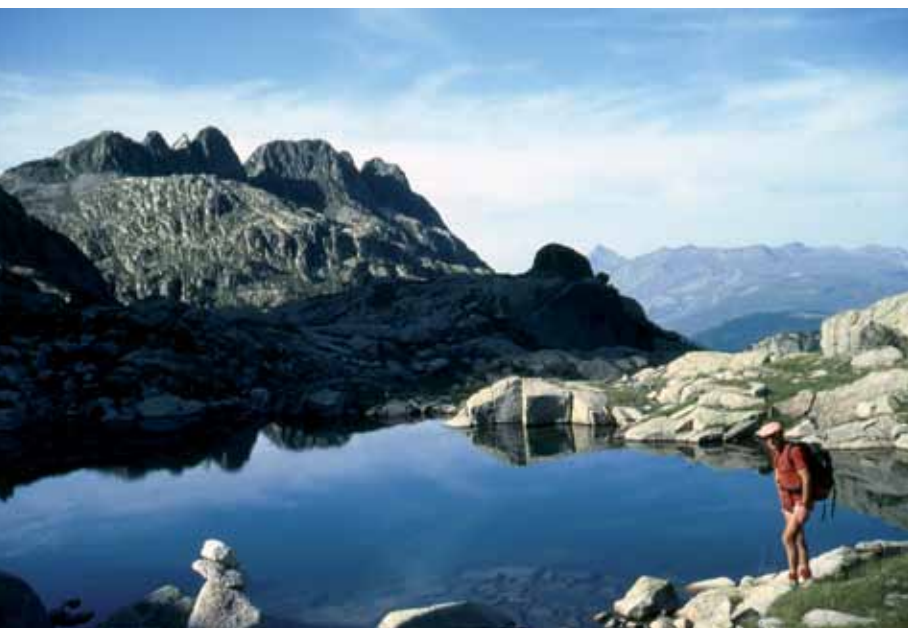
Lac de Colomers.