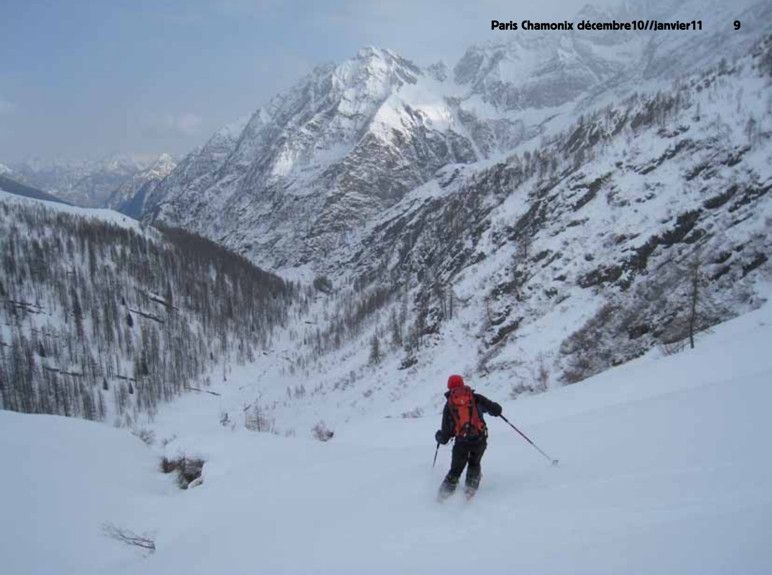
Descente du Pizzo del Forno.

di Magnello, magnifique village d'alpage à 1800 m. Puis l'on poursuit facilement en direction du col Cross Cavorgn, à 2531 m, à la frontière italo-suisse, entre le Pizzo Quadro et le Madone. Nous renonçons cependant à gravir le Madone, car l'arête est déneigée et malcommode, le temps est maussade et le vent glacial. Nous descendons rapidement par l'itinéraire de montée à Campo, où nous devons attendre deux heures et demi le car postal de 17h, en nous abritant dans le hall de l'hôtel, celui-ci et le café-restaurant attendant étant fermés le lundi !