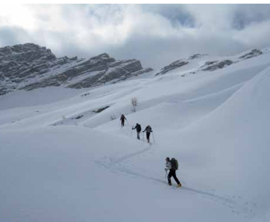
Sous le Passo della Fria.

De l'Alpe di Porcaresc, on atteint rapidement le Passo della Cavegna, qui donne accès au val di Campo, mais la descente est encore longue. Il faut d'abord franchir, par un système de vires, un ressaut raide coupé de petites barres, où le meilleur itinéraire est difficile à déterminer depuis le haut. Puis, parvenus au fond du vallon, au niveau du pont sur le Rio Sfi, il faut remettre les peaux pour rejoindre une cinquantaine de mètres plus haut sur la rive gauche, la trace du chemin d'été qui domine de profondes gorges impraticables.