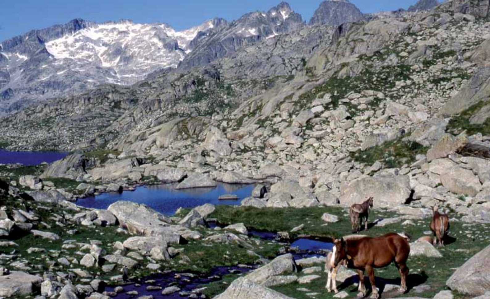
Lac des Mangades.

de Port et monter au col de Saburo (2670 m). En descendre vers la rive sud du lac de Saburo, passer à l'ouest de ceux de Mar et de Colomina. Le refuge (2400 m) est sur la rive sud.