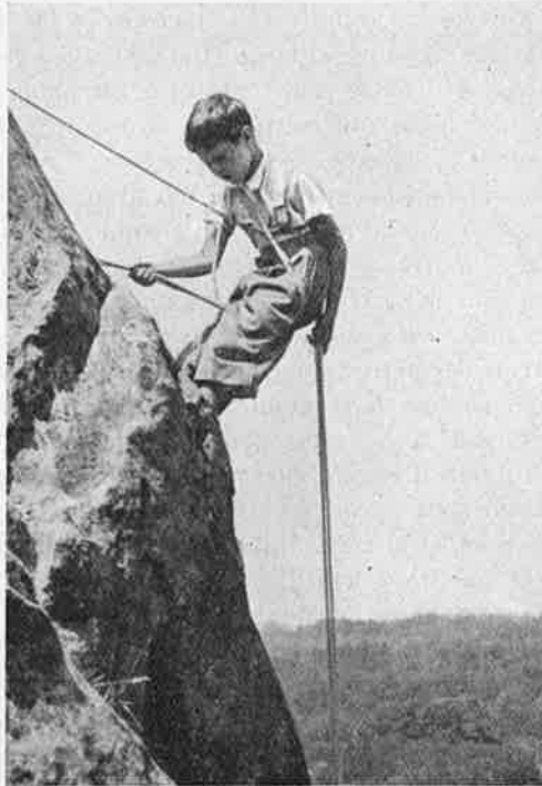
Comment on devient alpiniste !!