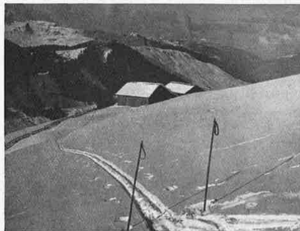
Près des Châlets de Nyons à Morzine