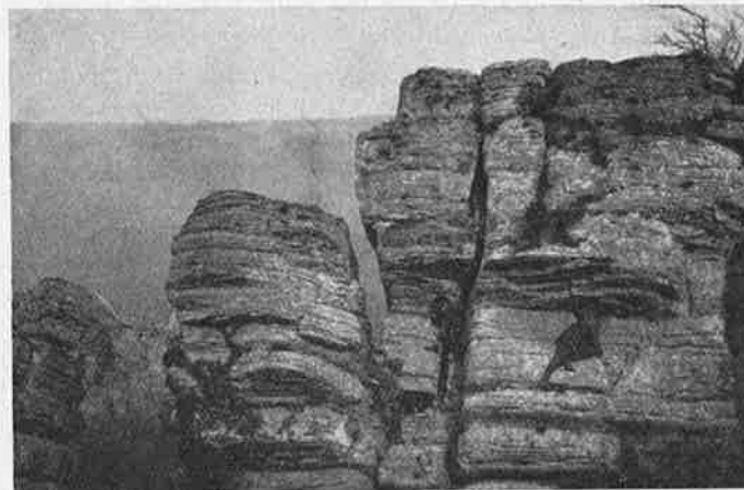
Dans les Rochers de Cormot

En juillet 1933, un nouveau déplacement avait lieu. Les varappeurs s'exercèrent cette fois dans une des nombreuses combes pittoresques que l'érosion a sculptée puissamment au Sud de Dijon, dans la longue chaîne de collines qui a donné son nom au département. Les combes de Fixin et de Brochon offrirent à nos rochassiers parisiens un grand choix de dalles, fissures, etc., et une superbe descente en rappel de 35 mètres dans le vide.