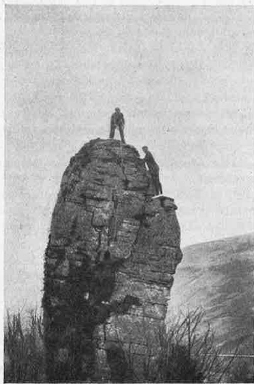
Escalades à Cormot