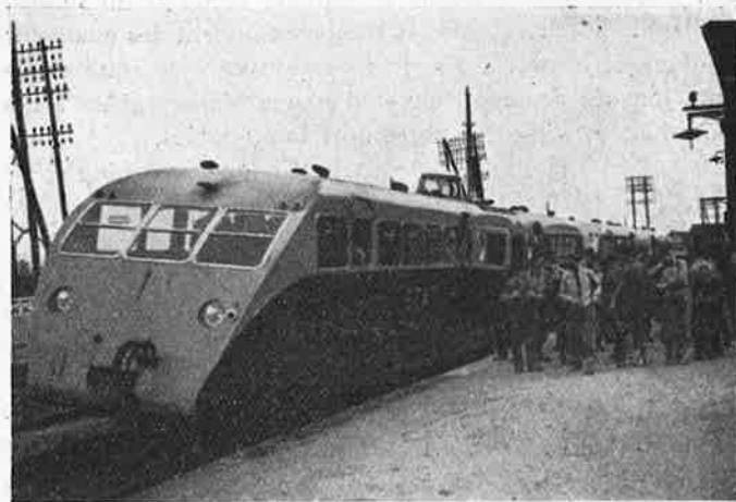
Collective de la Section de Paris en autorail spécial

Vétheuil, en groupes divers réunis selon les goûts et les sympathies de chacun.