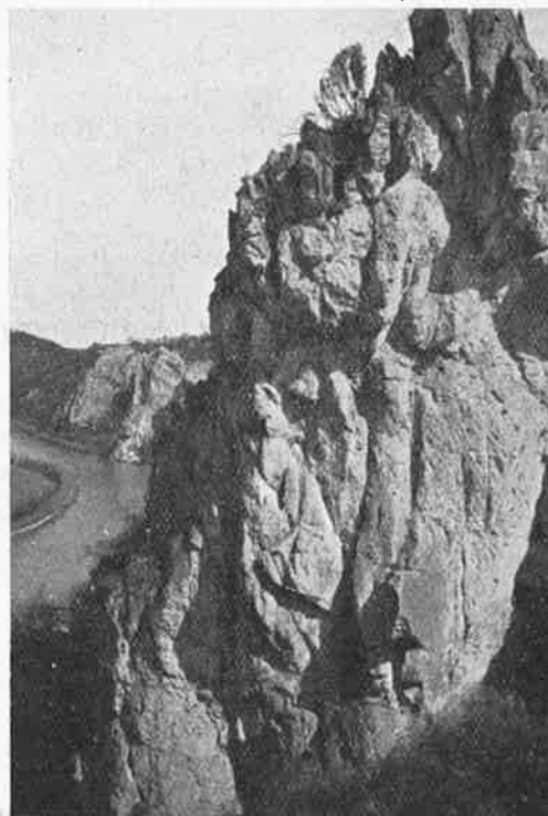
Les rochers de Waulsort en Ardennes belges

Première attraction de la journée : traversée de la Meuse en bac — également sans histoire. — Et nous voilà longeant les falaises rocheuses de la rive droite de la Meuse. Enfin notre dévolu est jeté sur l'aiguille de la Jeunesse et tandis que les sybarites de la collective (la très grande majorité, hélas !) s'installent confortablement sur l'herbe pour déjeuner, trois cordées disparaissent dans les rochers. Après deux heures d'escalade exposée, nous les voyons