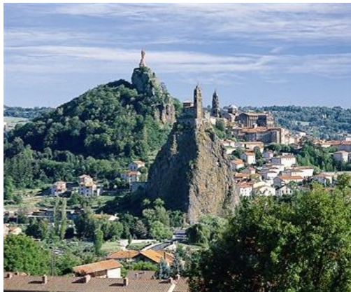
Puy en Velay