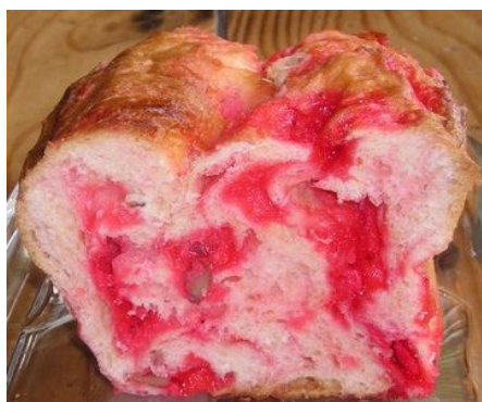
Brioche aux pralines