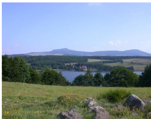
Lac de Saint Front