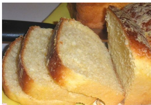
Brioche à la fleur d'oranger