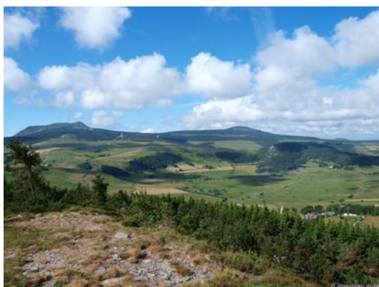
Le grand spectacle

Rocher tourte, les Estables, mont Mézenc (1753m), Grosse roche, Dents du diable 23km, +1000, -700