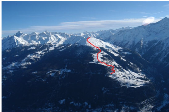
Descente par bonne neige...