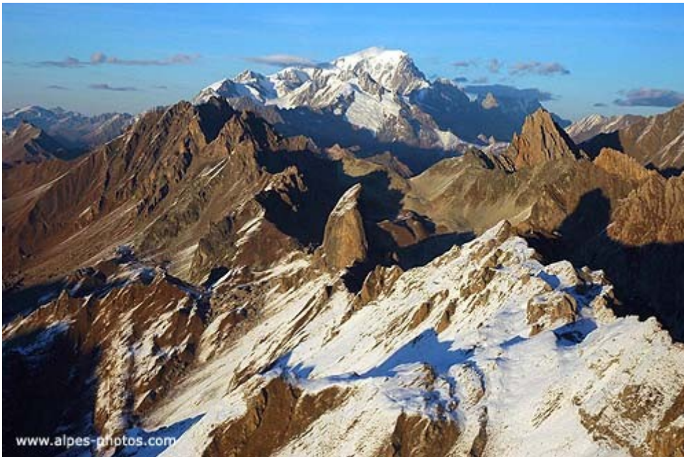
La Pierra Menta au premier plan et au fond le Mont-Blanc – Beaufortain http://www.alpes-photos.com/paysage56.htm

Demandez des renseignements si vous souhaitez souscrire une assurance annulation.