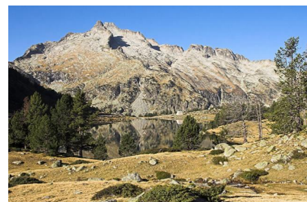
Pic du Néouvielle

Niveau requis : soutenu et ▲▲ (voir définitions sur le site du Caf Idf) ; pour randonneurs-campeurs habitués au portage de leurs effets personnels sur des étapes de 5 à 7 heures effectives de marche par jour sur et hors sentiers montagnards avec passages de névés possibles (altitude 1290 à 2507 m) et accoutumés aux contraintes du bivouac (manque de confort, marche plus longue pour trouver un terrain adapté, intempéries, poids du sac, froid nocturne lié