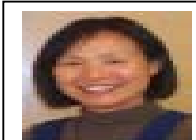
Mademoiselle Ping aime beaucoup le pain de seigle de Thiézac

Lundi 13 Septembre : Nous nous rendons d'abord à la boulangerie de Thiézac, renommé mondialement pour son pain de seigle (ce n'est pas Mademoiselle Ping qui me contredira: cliquer sur le lien ). Hélas la dernière fournée datera du Vendredi précédent, espérons que les autres pains soient tout aussi bons. Nous remonterons ensuite l'autre versant de la vallée pour atteindre le buron de la Tuillière. Puis c'est la ligne de crête directe pour atteindre le point culminant de notre circuit, Le Plomb du Cantal (1855m). Ensuite tout schuss par la piste rouge ou le GR pour la Gare du Lioran et retour à Paris via Clermont-Ferrand.