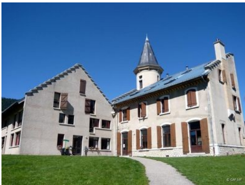
Notre hébergement sur Autrans

Les distances sont relativement faibles mais le dénivelé est assez important. Dimanche et Lundi nous ferons une boucle donc votre sac pourra être léger. Pour obtenir l'accord il suffit de me rencontrer lors d'une randonnée dominicale.