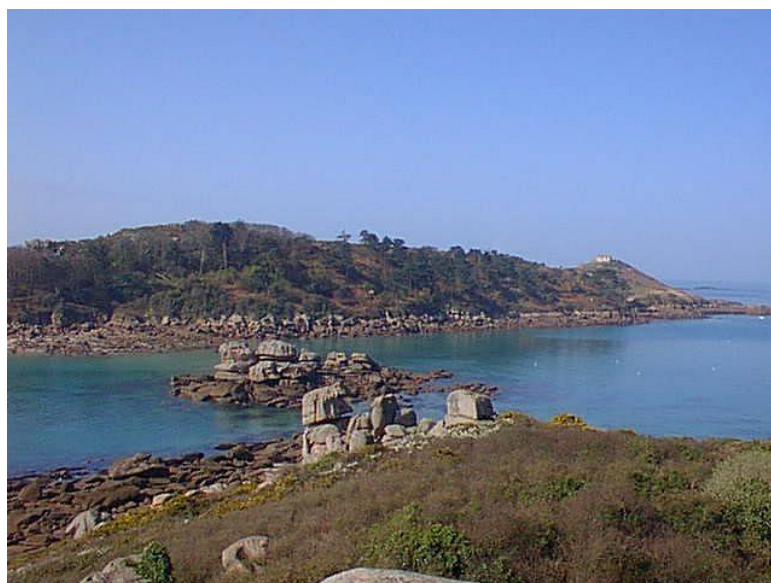
Ile de Millau à marée haute