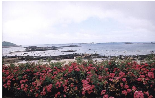
Plages de Trébeurden

Nous profiterons de notre séjour pour savourer un repas fruits de mer le dernier soir.