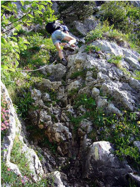
Le Pas des Barres.

Nuit en demi pension ; réservation effectuée le 29-04-2011, Chalet de la Hulotte; (80€ d'acompte, 35€ par personne en demi pension).