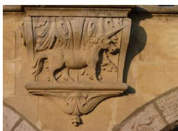
Arras - Octobre 2011