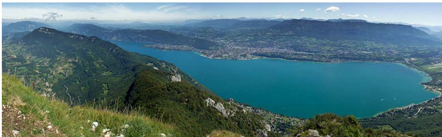
Le lac du Bourget (en été !)

L'an dernier, nous avons randonnée dans le Jura méridional en traversant le massif du Grand Colombier dans le Bugey, de Bellegarde-sur-Valserine à Culoz. Le Jura, qui se prolonge encore vers le sud où il devient savoyard, longe et domine le lac du Bourget. C'est sur cet itinéraire de belvédères sur les Alpes toutes proches que je vous emmène cette année.