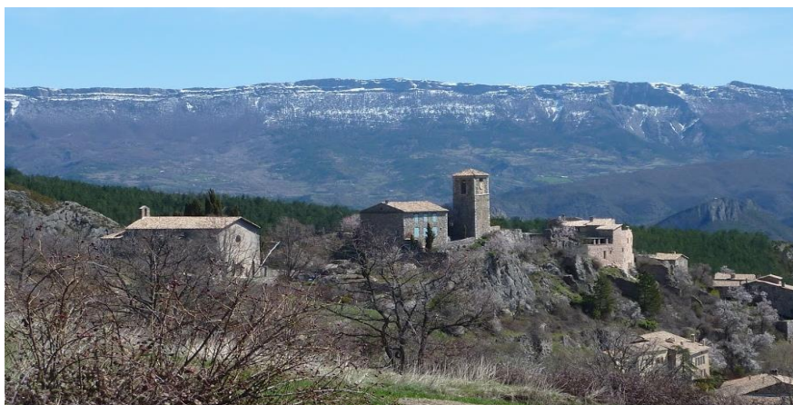
Village de Courbons (photo JPD Pâques 2010)

Comprenant l'hébergement à l'hôtel avec le petit déjeuner du samedi matin à Sisteron, l'hébergement en ½ pension en gîte à Saint Geniez (boissons comprises) et en hébergement simple en gîte à Thoard, le repas du dimanche soir ainsi que le petit déjeuner du lundi matin pris à Thoard, les frais administratifs du CAF, une participation aux frais d'organisation (correspondance, téléphone, cartographies, réservations SNCF TGV de l'organisateur, etc..) mais ne comprenant pas le repas du vendredi soir, les repas des trois midis, les en-cas et boissons diverses en journée, ni les transports SNCF A/R .