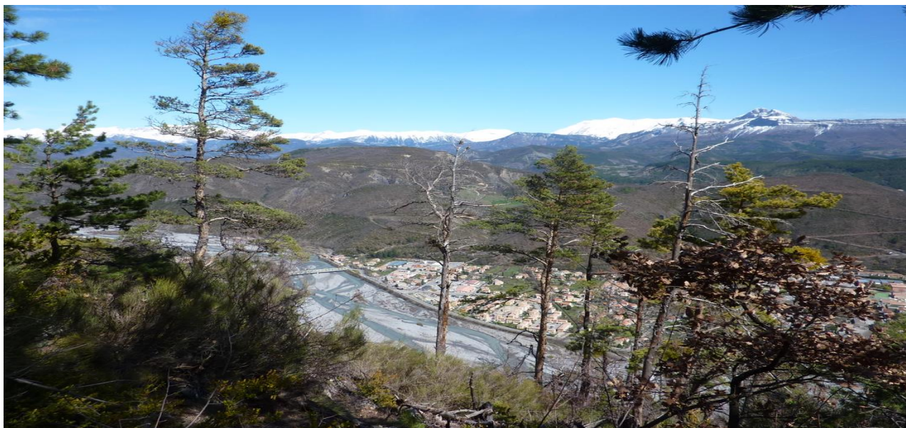
Digne les Bains vue du GR 6 (photo JPD Pâques 2010)

Un week-end de Pâques dans les Préalpes en Haute Provence au départ de la citadelle imprenable de Sisteron à destination de la capitale de la Provence Digne les Bains. Contraste saisissant assuré avec les grandes Alpes en toile de fond ainsi que la douceur de la Méditerranée pendant ces 3 jours.