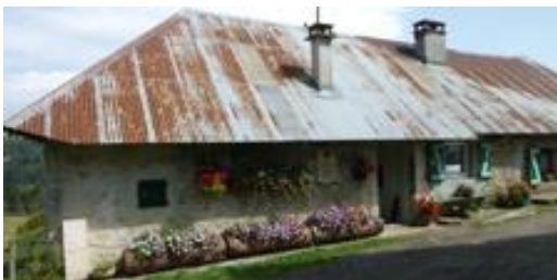
Ferme d'alpage, Tome des Bauges.