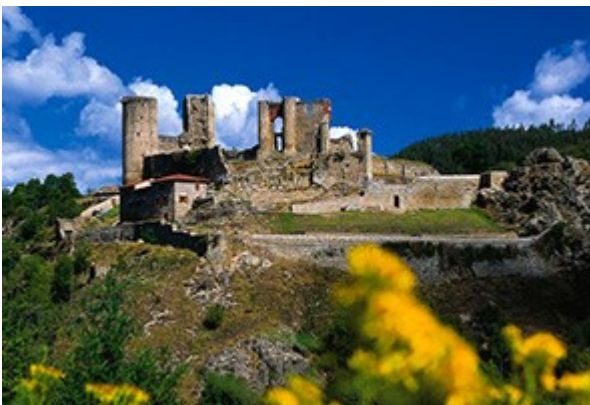
Château de Rochebaron

Distance étape : 22 km environ, durée approximative : 5h30.