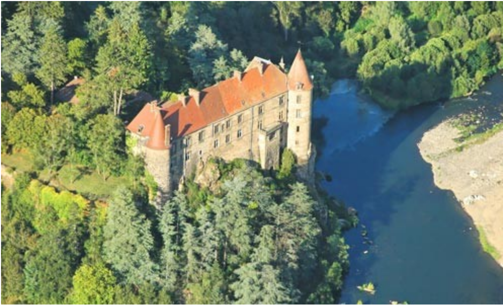
Château de Lavoûte

Distance étape : 26 km environ, durée approximative : 7h00.