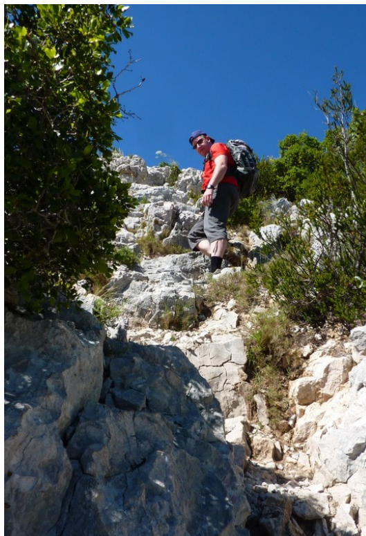
Montée au belvédère de l'Essaidon

Bureaux : 12 rue Boissonnade 75014 PARIS – Adresse postale : 5 rue Campagne Première 75014 PARIS