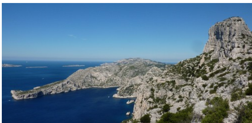
Cap Morgiou et Grande Candelle (photo JPD – 04/2014)

Distance 15 km ~ - dénivelé +1100m / -1050m ~ 5h00 de marche effective