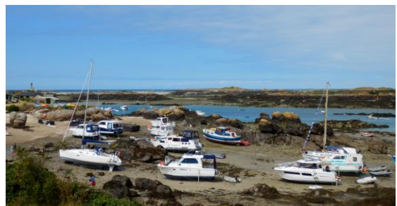
Archipel à marée basse

Cette journée (sans activité principale liée à la randonnée) nous autorisera une escapade vers l'archipel des Îles Chausey avec une traversée maritime (26,90€ A/R non compris). Balade contemplative et pique-nique sur l'île avant un retour sur le continent.