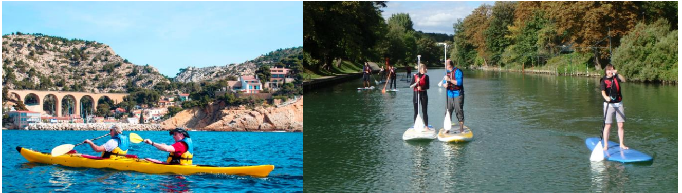
Calanques de la Côte Bleue - Viaduc de la Redonne Pâques 2016 et session paddle Joinville 10/2016

- kayak de mer et paddle sur lequel de nouvelles sensations sur ce support à la mode qui permet de belles sensations de glisse et qui se révèle un super engin de balades pour découvrir la côte autrement (combinaison fournie par le club).