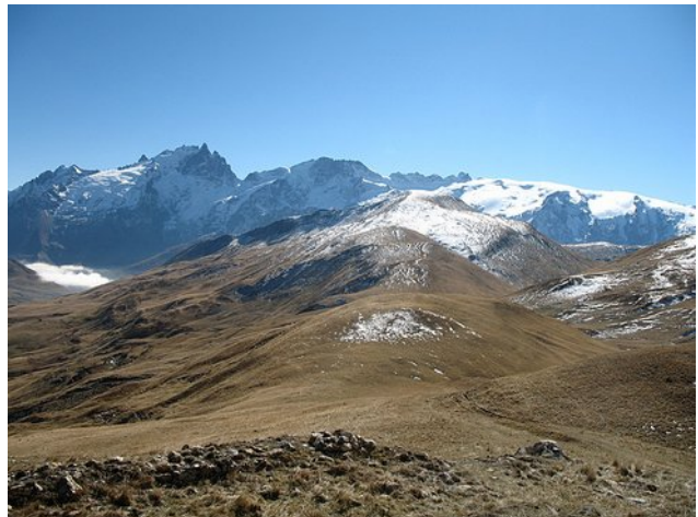
Panorama sans la neige ;-) (automne 2015)

Allons bivouaquer sous l'œil de la Meije ! C'est trois jours de vagabondage en autonomie totale sur le plateau d'Emparis, magnifique belvédère sur les plus célèbres faces nord et glaciers de l'Oisans.