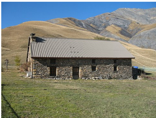
Baraque de la Buffe sans la neige ;-) (automne 2015)

De notre point de rendez-vous, nous rejoindrons en taxi Le Chazelet, point de départ de notre randonnée, que nous devrions atteindre peu après la mi-journée. Après avoir pique-niqué, nous nous mettrons en route pour la Baraque de la Buffe à proximité de laquelle nous installerons notre premier campement.