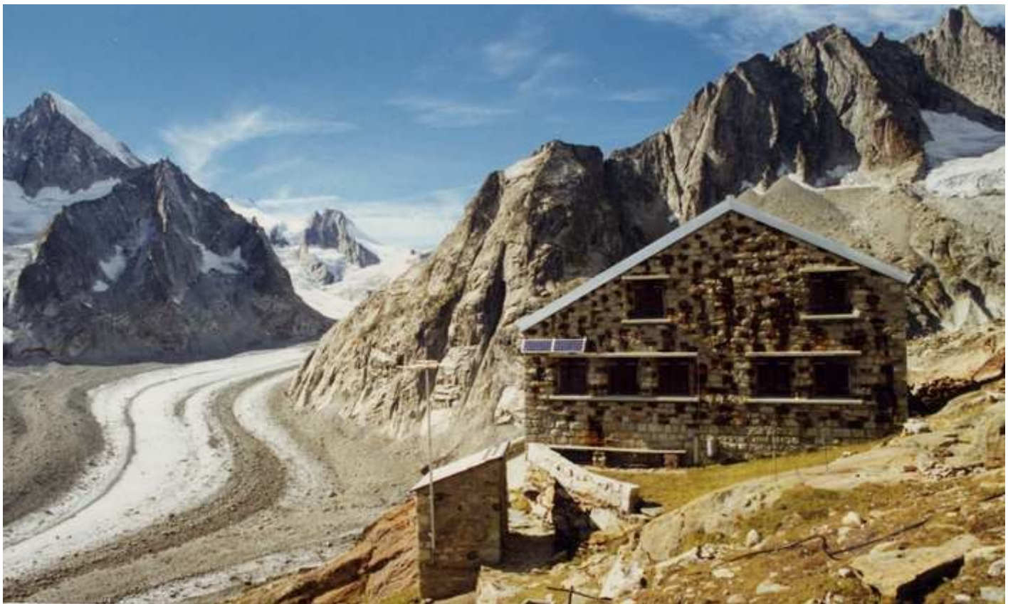
Aletschhorn et Oberaletschhorn hutte