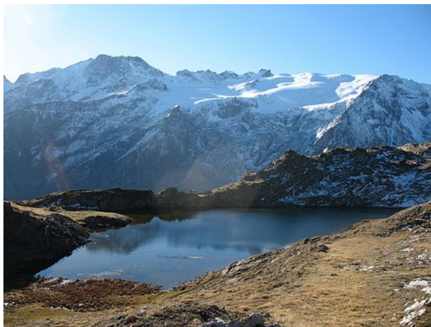
Lac Lérié sans la neige ;- ) (automne 2015)

Notre objectif du jour sera le Gros Têt, sommet de 2 613 m d'altitude, point culminant de notre randonnée. Les plus célèbres faces nord et glaciers de l'Oisans s'offriront à notre regard. Nous gagnerons ensuite notre deuxième lieu de bivouac, le lac Lérié, via le Petit Têt, le col du Souchet et un petit détour par le lac Noir.