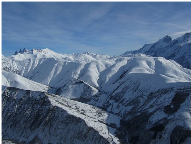
Les Aiguilles d'Arves, le Gros Têt, Surre Sarroi et Besses-en-Oisans

Cette dernière journée de vagabondage, nous conduira à Surre Sarroi, sommet de 2 362 m d'altitude, depuis lequel nous regagnerons Le Chazelet en revenant en partie sur nos pas.