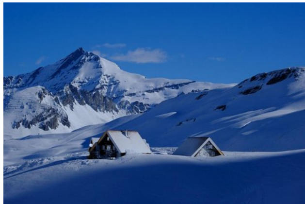
Refuge du Fond des Fours en hiver

Le refuge du Fond des Fours, idéalement situé au cœur du parc national de la Vanoise à 2537 m d'altitude, sera notre camp de base depuis lequel nous aurons la possibilité de rejoindre des sommets de plus de 3000 m, ce qui est plutôt rare en raquettes en neige.