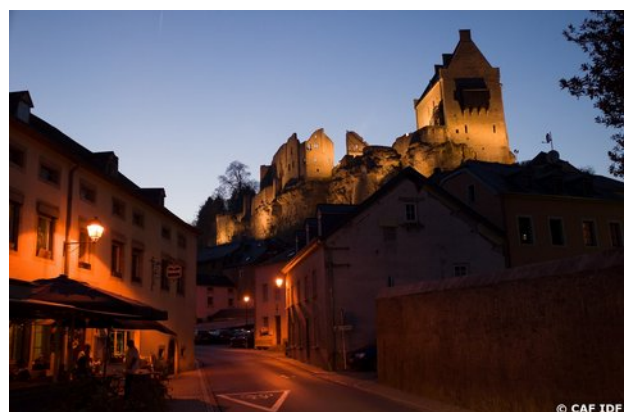
Village et château de Larochette