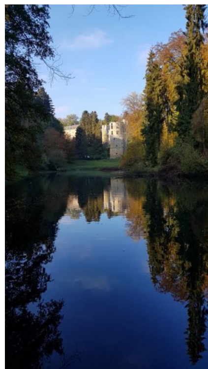
Château de Beaufort