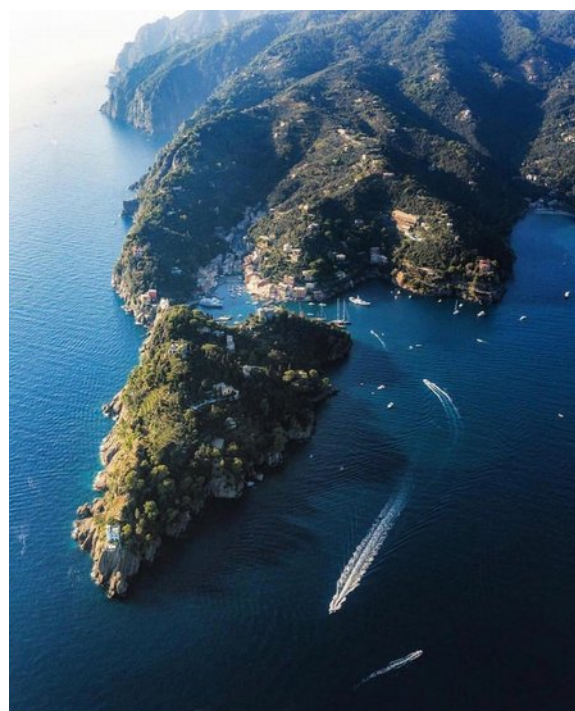
Portofino et son phare

Faro di Portofino , à son extrême pointe. En option , visiterons-nous le Castello Brown et son parc de sculptures (5€) ? Dînerons-nous à Portofino ? Un bus nous amènera ensuite à Santa Margherita, puis un train direct en 35 minutes à Levanto.