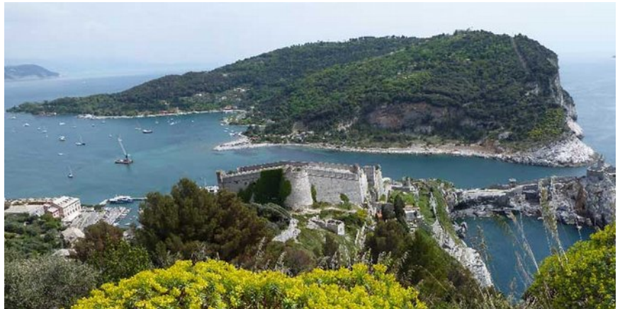
Porto Venere et l'île de Palmaria

Revenus à Porto Venere, ceux qui le souhaitent peuvent en option embarquer (à 15h, pour 13€?) pour faire le tour de Palmaria, Tino et Tinetto en bateau , et approcher de leurs grottes. Dîner à Porto Venere.