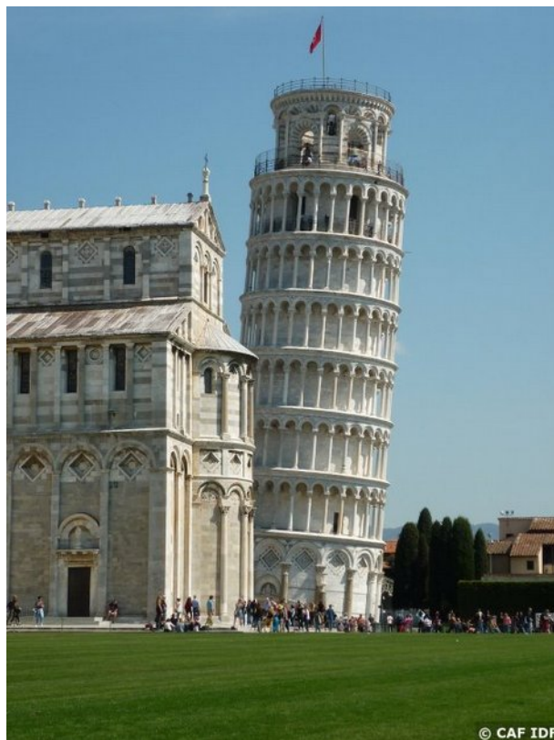
Tour de Pise