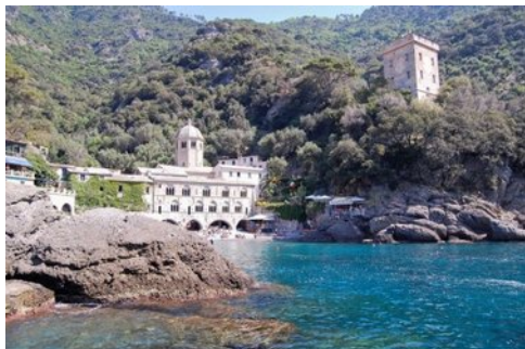
Abbaye et plage de San Fruttuoso

Nous quittons aujourd'hui les Cinque Terre pour explorer, à 40 km vers Gênes, la péninsule de Portofino , sauvage, rocheuse et boisée. À partir de Camogli à son extrémité ouest, des sentiers nous permettent d'en faire le tour et de monter à son point culminant, le Monte di Portofino (610m). Nous descendons ensuite en bord de mer vers l' abbaye de San Fruttuoso . Après une baignade, nous gagnons Portofino , sorte de Saint-Tropez local avec ses yachts et sa clientèle fortunée. Un sublime petit aller-retour nous conduit au