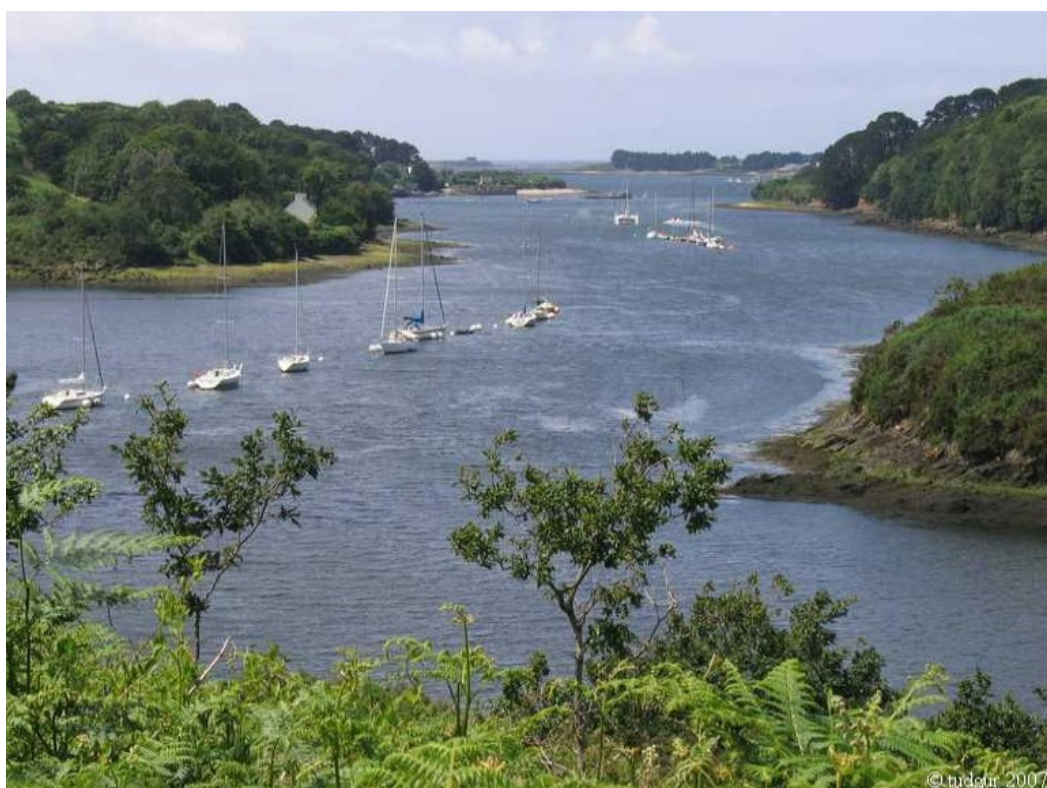
L'Aber Wrac'h

Caractéristiques du parcours programmé :