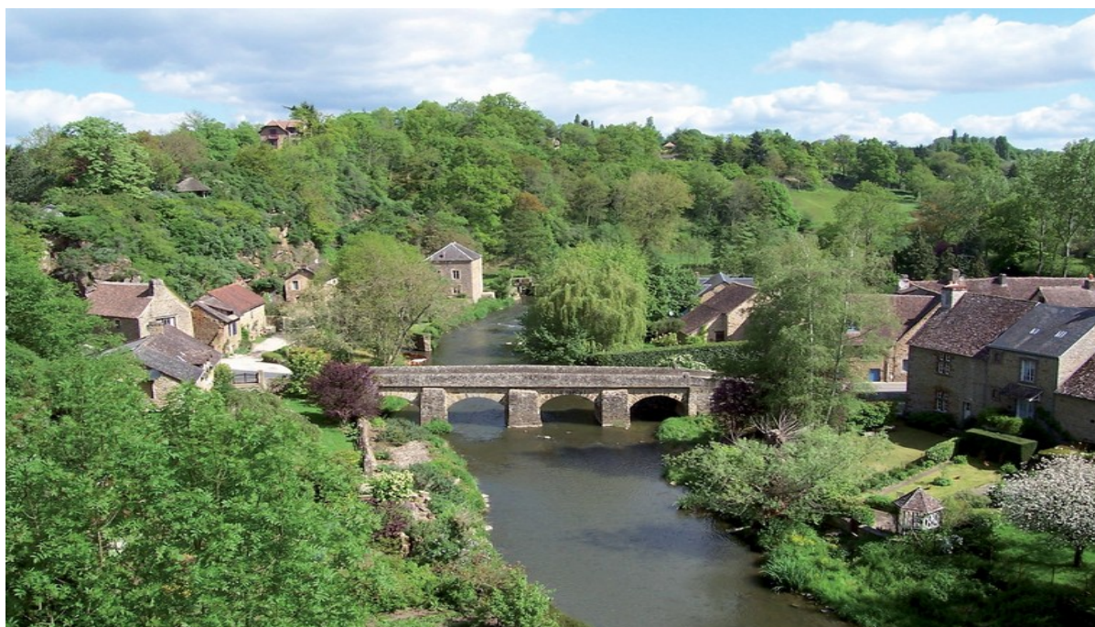
Saint Ceneri Le Gerei