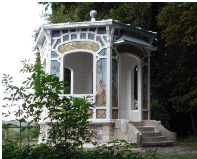
Le belvédère de Chatillon

Nourriture : prévoyez vos repas du samedi midi au dimanche midi.