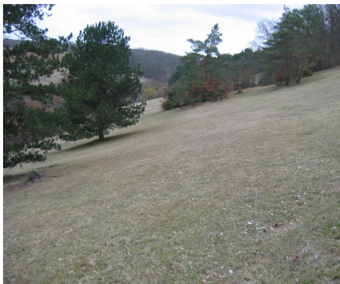
Les pelouses calcaires

Nota : chaque participant devra être autonome en matériel et nourriture, ... et n'hésitez pas à me contacter pour tout renseignement complémentaire.