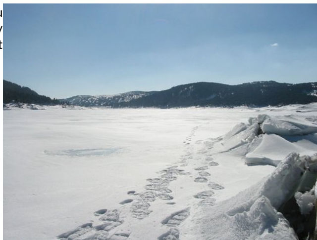
Lac des Bouillouses

Notre objectif du jour sera l'abri de l'Estany de Coll Roig au pied des pics Oriental et Occidental de Coll Roig. Pour y parvenir, nous aurons franchi le Portella de la Grava et longé le Lac des Bouillouses.