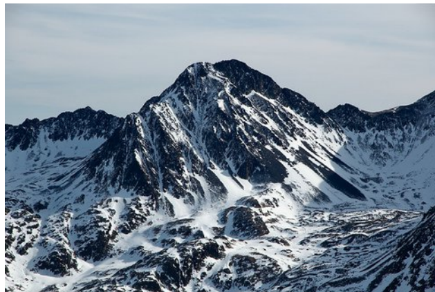
Puig Carlit (camptocamp.org)

Trois jours d'escapade autour du « toit » des Pyrénées-Orientales, le pic Carlit ou Puig Carlit culmine à 2921 m d'altitude. Vastes plateaux, lacs gelés, forêts de pins à crochets et crêtes seront à notre programme.