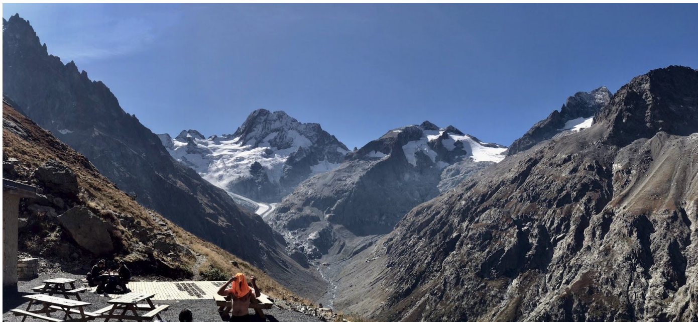
Vue sur le glacier de la Pilatte depuis le refuge Temple Ecrins.

Vous pouvez vous faire remplacer ou annuler votre inscription à tout moment avant le début de la sortie, moyennant les frais spécifiés dans les conditions d'annulation et de remboursement . À plus de 30 jours du départ, vous pouvez en outre souscrire une assurance annulation pour couvrir ces frais, à l'exclusion d'une franchise et du montant de cette assurance.