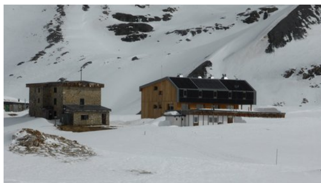
Refuge du col de la Vanoise en hiver

Cette sortie raquettes à neige se veut résolument très alpine. Nous ferons appel au matériel et aux techniques de base de l'alpinisme.