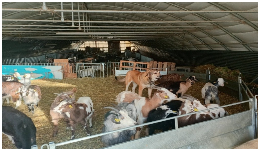
hiver 2026, les chevrettes de la ferme des Cabrettes

Un groupe WhatsApp sera créé afin de communiquer entre nous.