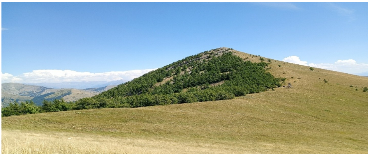
été 2024, au-dessus de la ferme des Cabrettes, col des Roux

Attention : départ le mardi 15 avec le train de nuit : 20h57 / Paris Austerlitz - Gap