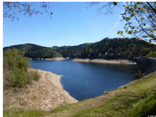
Barrage de Grandval (CAF16-RW54)